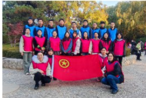
欢乐运动环节，团委组织大家到户外开展了青春追逐赛，利用地图实时定位。

不仅考验了选手们的知识储备，更考验了心理素质 and 反应速度。选手们团结协作、迅速思考、紧密配合，答题又快又准，赢得现场观众阵阵掌声。经过层层比拼，最终二队以绝对的优势荣获第一名。