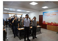
大队领导带领全体职工安全宣贯

为推动安全生产月活动开展，各项工作稳步推进，大队成立领导小组，研究制定《关于开展2023年安全生产月活动方案》，组织召开“安全生产月”活动启动会，正式拉开活动序幕。会议传达了局2023年安全生产月活动方案和相关部署要求，对大队安全生产月活动做出具体安排。大队机关全体、各经营单位负责人、安全员及项目经理进行了集中安全宣贯和安全承诺践诺签名活动。