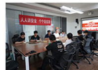
习近平总书记关于安全生产重要论述宣讲

开展安全宣贯。各单位围绕宣传贯彻习近平总书记关于安全生产重要论述，开展三级宣贯54场次，覆盖693人次。各项目组组织开展“安全生产大家谈”“班前会”“以案说法”等活动46次，参加员工473人次。