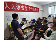
项目人员收看《十大逃生演练科普视频》

加强制度宣贯。把《安全生产法》、局《安全生产管理办法》以及大队新出台《安全生产责任制》等6项安全生产制度作为重点，开展学习宣贯。