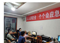
野外项目宣讲主题活动